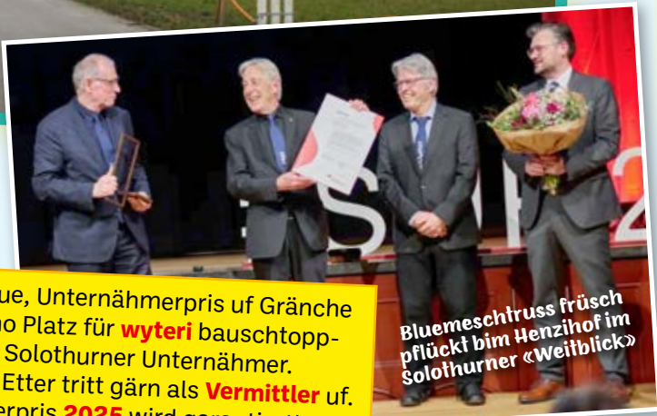
Blumeschtruss frösch pflückt bim Henzihof im Solothurner «Weitblick»

D'Gränchner hei dä Brote groche, do hetts für üüs vüu Fleisch am Chnoche . Inveschture i dr Hauptschtatt nur verpöhnt , wärde bi de Ühreler gfiiret und verwöhnt. Z'Gränche chame sofort afo baue, wird nid vor Gmein i d'Pfanne ghaue. Dr Gmeinrot schaudet schnäu, seit jo, schpüüt nid wie die angere Domino . Gschnäu mues do e Lösig ane, üs fröie jetz scho d'Schtüürinahme!