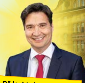
Dä lacht sich is Füschtli