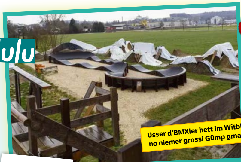
Usser d'BMXler hett im Witblick no niemer grossi Gümp gmacht

Wäutfrömd wird im Shtedtli planet, gar mänye Bauherr wüetig zahnet. Shtüürgälder wärde flott vernichtet, e huffe Quatsch wird umebrichtet. Verlore isch scho lang dr Fade , anschtatt jetz ändlich afo z'grave . Bauherre si, me hetts befürchtet , vor luter Fruscht uf Gränche gflüchtet. Dr «Wytblick» isch scho lang verlore , e Lösig vellicht i hundert Johre!