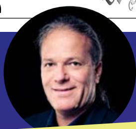
TOM FLEXIBLER GUSO-SCHEFF UND PRESSEARR

Seit jeher ein Schwärgewicht , welcher als Einziger etwas von teuren Blaggetten versteht. Folgt ausnahmslos nur den Anweisungen der Strippenzieherin . Wenn einmal dicke Luft herrscht, greift er zu einer Guttäre Grappa.